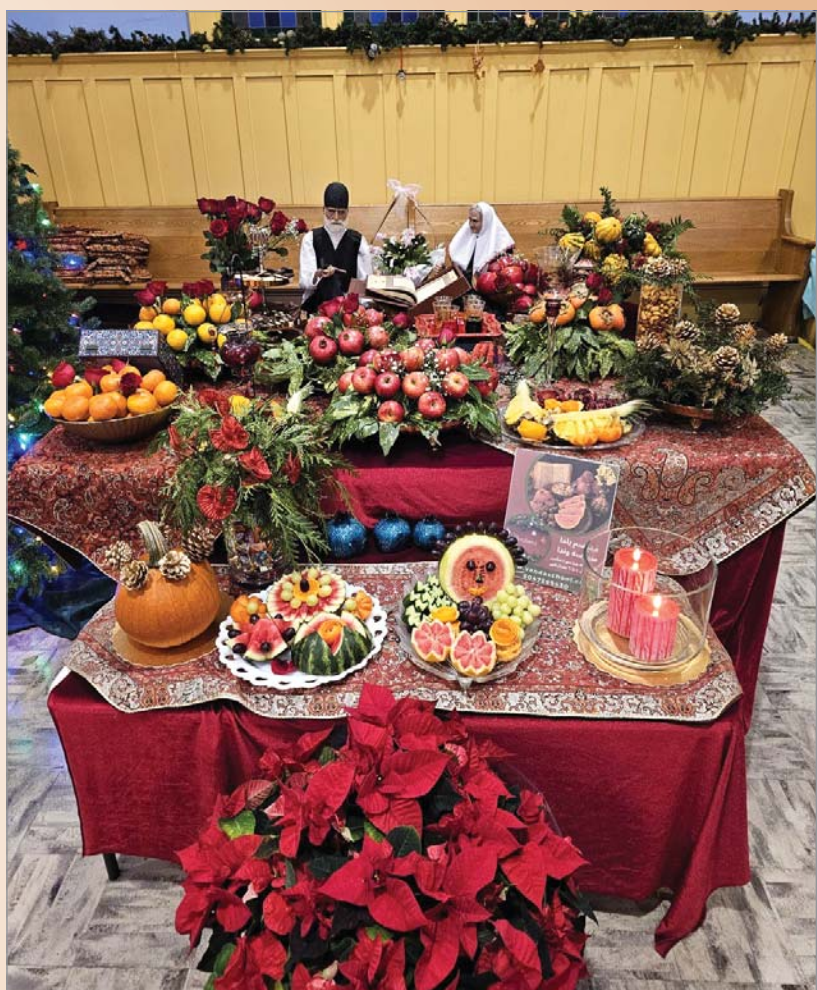
سفره یلدای آکادمی وندا ۲۰۲۴

ایرانیان در این شب در کنار خانواده جمع می‌شوند تا لحظاتی گرم و پرمعنا را سپری کنند. در گذشته، مردم دور کرسی جمع می‌شدند تا از سرمای شب در امان باشند. این دورهمی نماد اتحاد و گرما در زندگی جمعی است. خواندن اشعار حافظ و شاهنامه در این شب رسم بوده‌است. فال گرفتن با دیوان حافظ و خواندن داستان‌های شاهنامه