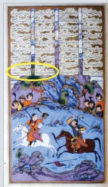
نبرد سهراب و گردآفرید، شاهنامه رشید، نسخه شماره ۲۲۳۹، محفوظ در موزه گلستان تهران، مورخ ۱۵۱۳۲/هـ ۱۸۱۲ م، مکتب اصفهان، ابعاد نگاره mm ۱۴۵ x ۲۷۰